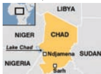
Mapa do Chade

O apoio francês é decisivo para que a força da UE possa existir. No entanto, a missão da EUFOR poderá ser de alto risco devido às ameaças dos